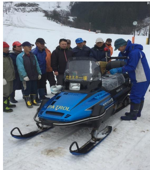
スノーモービル講習会