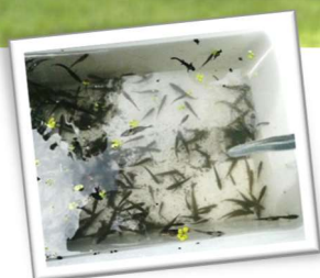
写真:網ですくったイバラトミヨ ドリームトープには、メダカ、ドジョウ、イモリ、ゲンゴロウ、ツチガエル、ヤゴなどがせい息していることを確認できました。