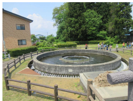
未来に伝えたい秋田インフラ50選 「関田円形分水工」

ちょっと前になりますが、7日に3年生は、社会科の学習で町めぐりを行いました。六郷地域を徒歩で巡ったのに続き、今回は、バスを使って六郷東根地域、千畑地域、仙南地域を巡り町の様子を調べました。それぞれの地域ごとの特色を知ったり、六郷地域と比較することを通して、美郷町全体の様子を知ったりすることができました。美郷町についての興味関心も高まってきたようです。実際に訪れることで、子どもたちは、美郷町のよさを発見していくようです。お家の方も子どもたちと「町めぐり」をしてみたいはいかがでしょうか。