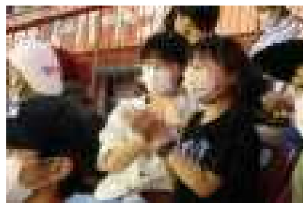
【二日目：仙台「アーケード街」散策、震災遺構「荒浜小学校」見学、八木山ベニーランド遊園】