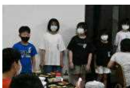
夕べの集いで、感想を発表!