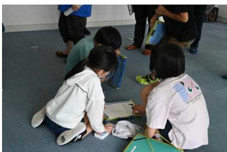
トレジャーハンティング...グループでルールを確かめ、一つ一つクリアして!