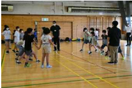
活動① ジャンボじゃんけん