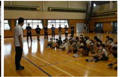
ワクアス体育館で「始めの会」