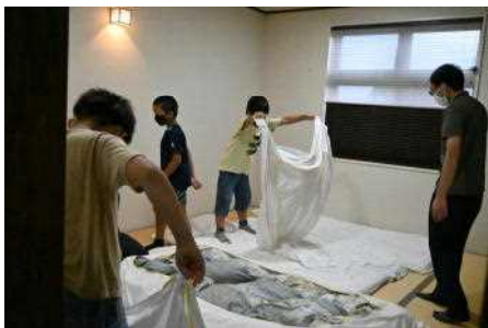
布団を敷きます! 格闘中?