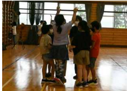
グループで知恵を出し合ったり喜んだり