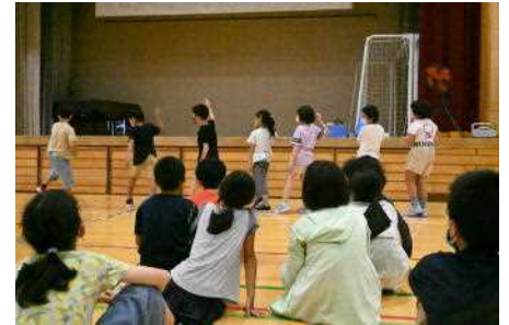
パラパラモーション