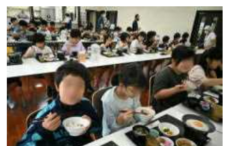
夕食も朝食もおいしくいただきました!