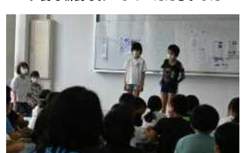
終わりの会で活動を振り返って