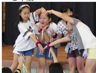
しい竹(4竹)ダンサーズ