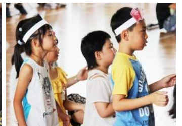
お友だちも聞き入って